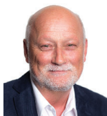
Zentraler Fachberater Obst, Gemüse, Hopfen, Zierpflanzen